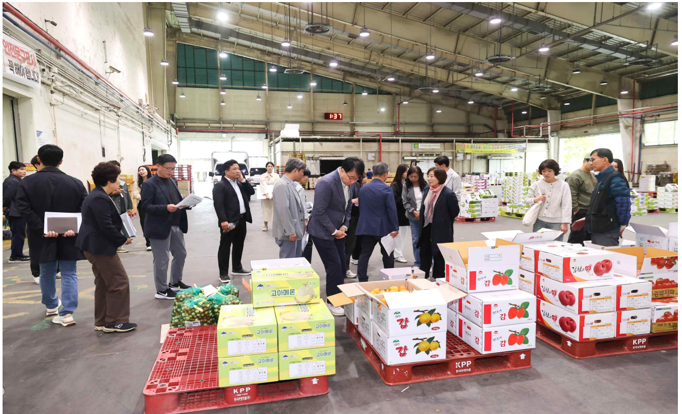
청과동 현장 점검