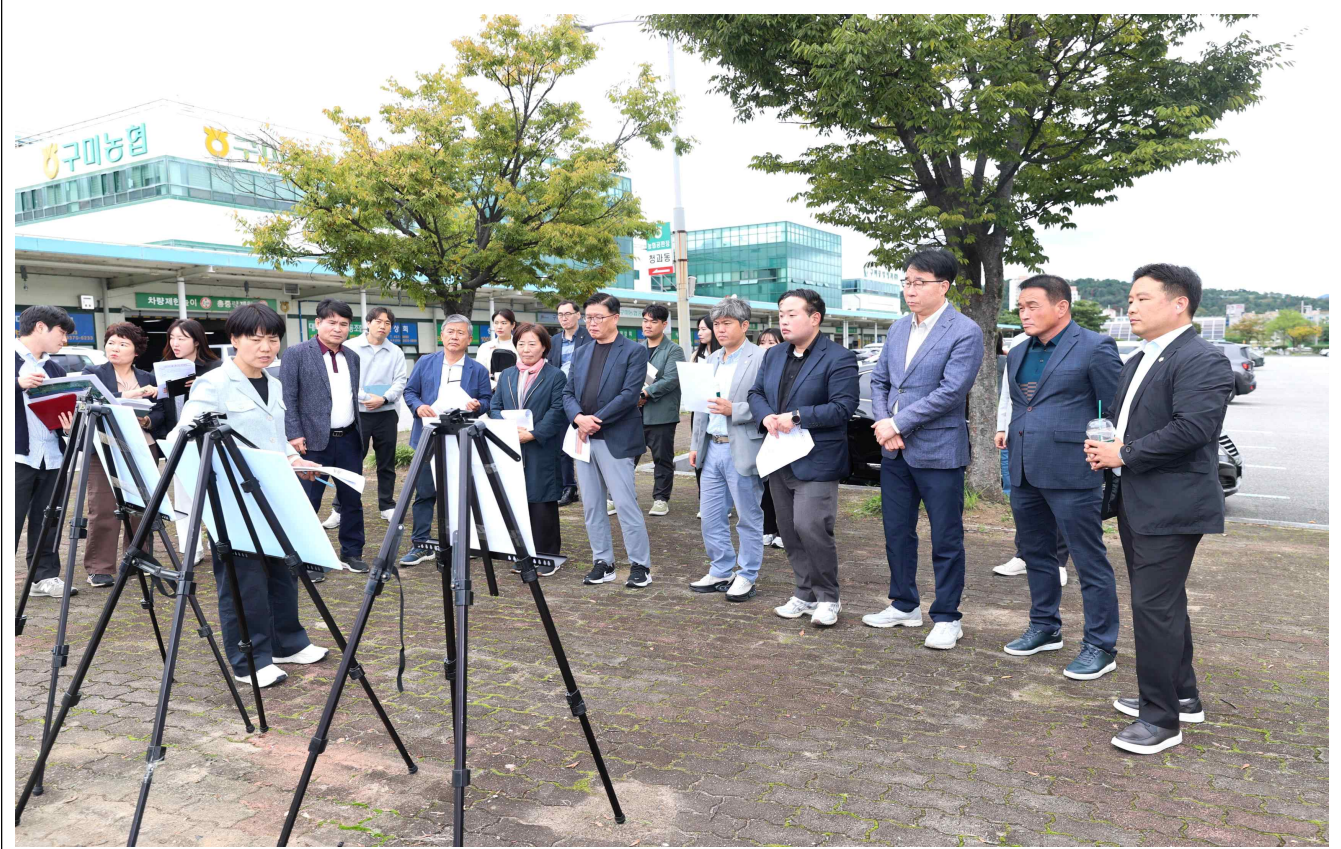
구미농산물도매시장 현황 청취