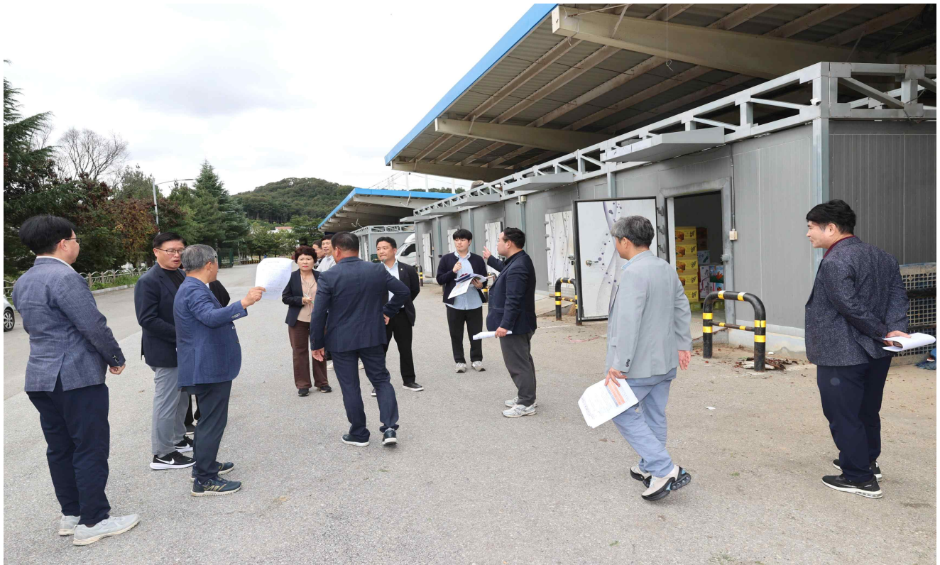
채소동 현장 점검